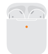
Не напълно заредени